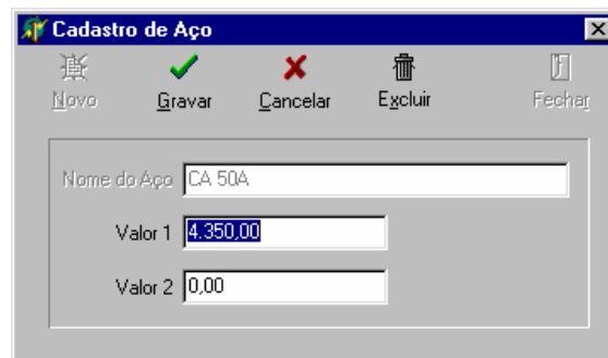
Figura 5. Cadastro de Aço e f_{yd}

O primeiro comando, do menu cadastro, é o comando aço, que quando acionado mostra uma janela de cadastro do tipo de aço a ser utilizado, com sua tensão f_{yd} , determinante nos dimensionamentos tanto dos pilares quanto das fundações, conforme citado no capítulo 2.